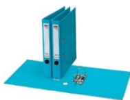
Classeur à levier 4 cm