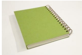
Cahier à spirales